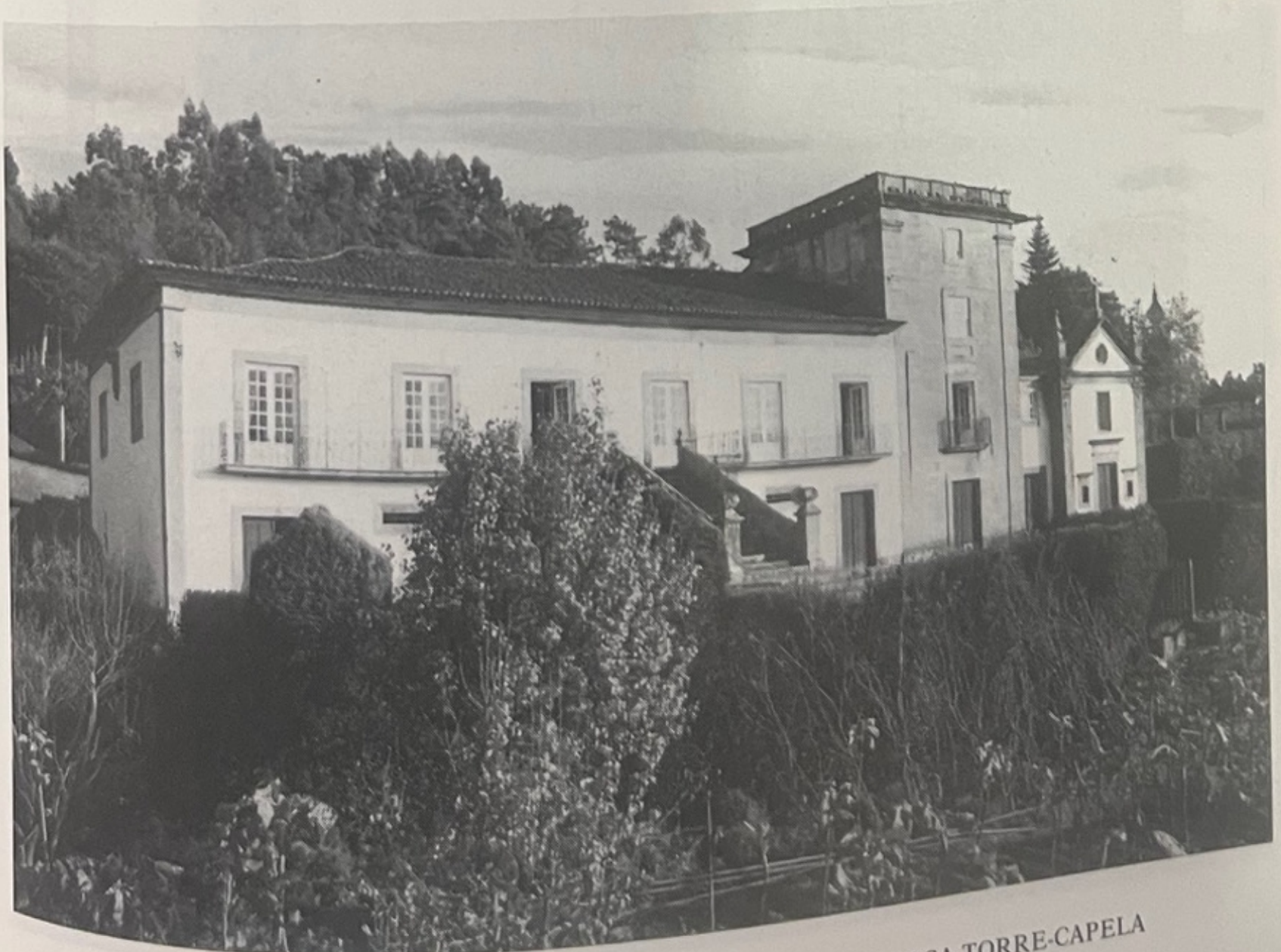
FIG. 4 — NOTÁVEL COMPOSIÇÃO ARQUITECTÓNICA: CASA-TORRE-CAPELA