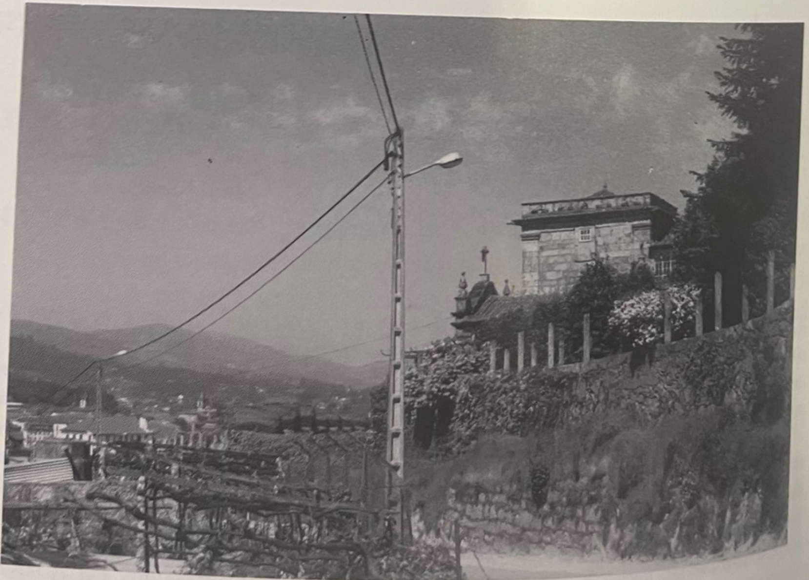
FIG. 2 — A CASA DOMINA A SOBERBA PAISAGEM SOBRE A VILA E O RIO VEZ