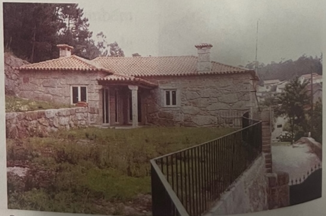
Casa em reconstrução

Houve também grande alteração nas acessibilidades: foram abertos e alargados caminhos facilitando o