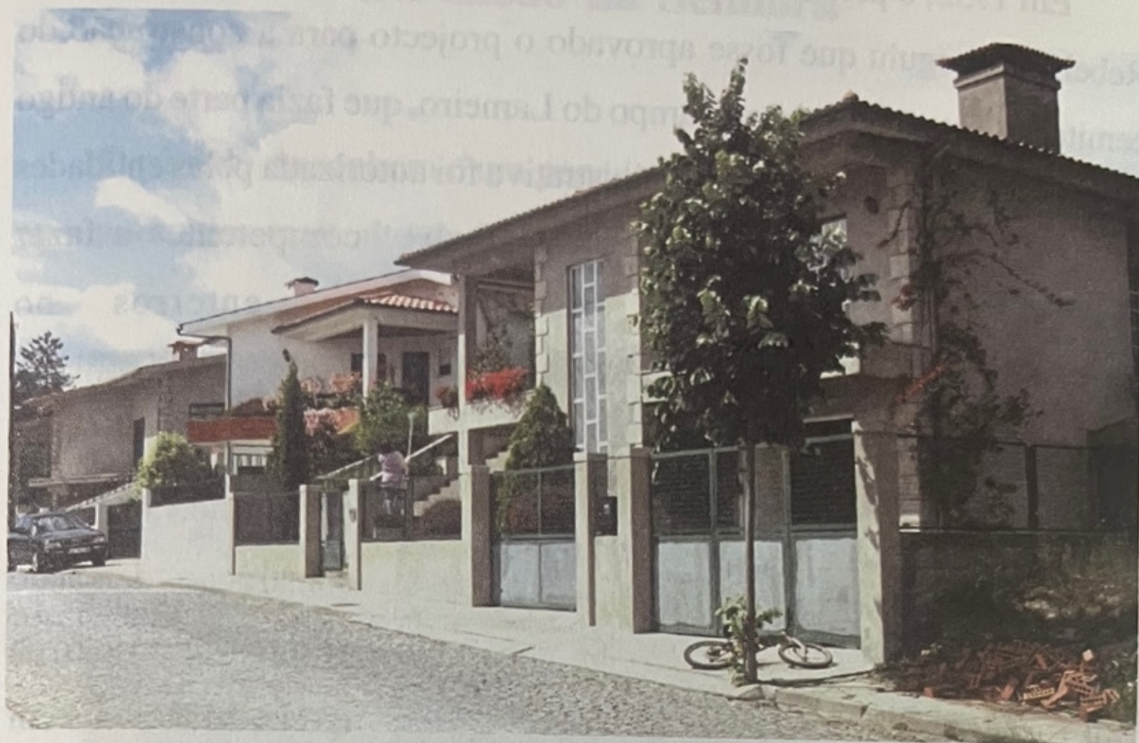
Loteamento de Cadói

acesso a alguns lugares, foram pavimentados muitos outros que durante o Inverno se tornavam intransitáveis e ainda se fizeram passeios para peões, junto à estrada nacional n.º 14.