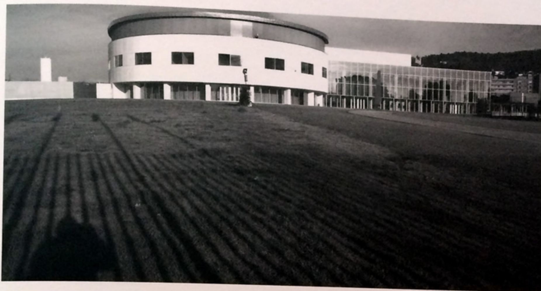
Edifício de Nanotecnologia, INS - Braga

As imagens da cidade são momentos que fixam realidades e transportam imaginários. Revelam espaços, construções, pessoas e metabolismos, num jogo de luz e de sombra que induz leituras muito próprias por quem as vê. Provocam as emoções da estética, a retrospectiva da história e a perspetiva do futuro, fazendo emergir tudo o que ali não está. Há uma omnipresença da forma que o granito preserva de modo austero, mas irrepreensível. O mesmo granito que, ... abrigou celtas, protegeu romanos, e alojou suevos e visigodos, ... enformou muralhas e igrejas, desenhou ruas e estradas, esculpiu monumentos e testemunhou o evoluir dos tempos, ... onde André Soares deixou o seu talento. Nas pedras das ruas e das casas de Braga, da urbe, de Tibães ou do Bom-Jesus, estão raízes e memórias que são património sentido de uma comunidade, aberto e partilhado com todo um mundo que a cruza, visita e vê em diferentes suportes, incluindo estas fotografias bonitas. Há um sentir do místico, na interface entre a terra e o céu, nas igrejas de rezas, promessas e de introspeções íntimas, no toque divino dos raios de luz especularmente refletidos.